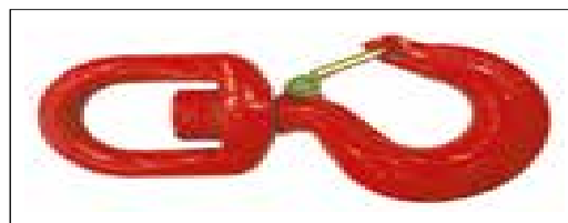
Sécurité : crochet pivotant autobloquant homologué.

* Vitesse de crochet sans charge. ** Sans support.